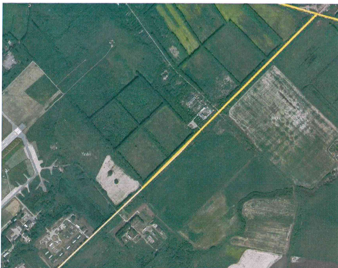
Схема для разработки проекта планировки и проекта межевания части территории Савинского сельского поселения Пермского муниципального района Пермского края с целью размещения линейного объекта – автомобильная дорога «р. Пыж-Ванюки» - Сокол